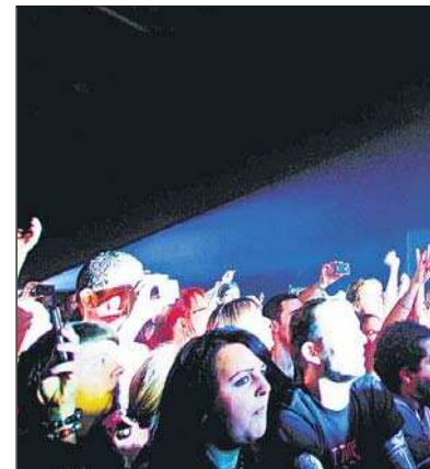
Die Fans der britischen Rockband zeigten s