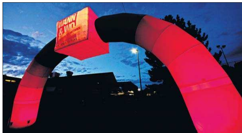
Kurz nach Sonnenuntergang luden Skunk Anansie zum Tanz.