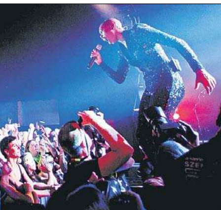
... sich begeistert.

Dass Skunk Anansie aber stets auch politisch bleiben wird, bewiesen Songs wie „On My Hotel TV“ oder „Yes, It's Fucking Political“. Nicht nur, aber gerade auch wegen der anhaltenden Unruhen in ihrer Heimat Großbritannien sind diese aktueller denn je. Sichtlich angetan zeigte sich die Frontfrau auch von den Jüngsten im Publikum, die an diesem Abend die Chance bekamen, ein kindliches „Fuck“ ins Mikro zu flüstern. Auch die neuen Tracks des Albums „Wonderlustre“ überzeugten auf ganzer Linie, was Skin „stagedivend“ und singend gleichzeitig eindrucksvoll zur Schau stellte. Alles in allem ein einzigartiger, unvergesslicher Abend. Ach ja, „Hedonism“ durfte natürlich auch nicht fehlen, genauso wenig wie Skins einzigartig Anbindung zum Publikum. So verbrachte sie den Schluss der eindrucksvollen Darbietung mitten unter ihren Fans, die ihr – einer postmodernen Geschichtenerzählerin gleich – an den Lippen hingen. Chapeau!