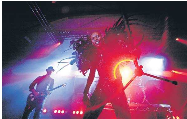
Skunk Anansie lieferten im Hohenemser Tennis.Event.Center eine tolle Show.

Sängerin Skin wirkte am Anfang etwas verhalten, steigerte sich aber im Verlauf der Darbietung in pure Ekstase.